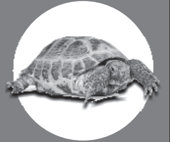
Tortoise 100 - 150 Years