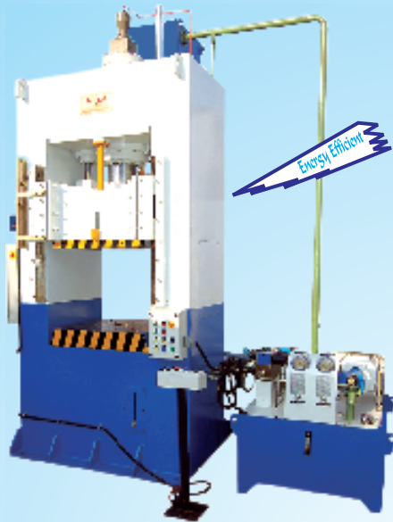
Closed Frame High Speed Deep Drawing Press

Special Purpose Machineries High Speed Hydraulic Deep Drawing Press Rubber/Bakelite Moulding Hot Presses Hydraulic Presses, Power Packs, Cylinders Computer Sambrani, Dhoop stick M/c.. Valve Pressure & Life Cycle Testing M/c. Pneumatic, Hydro-Pneumatic Presses Arecanut Leaf Plate, Semia-Idiyappam, Chapati Press.