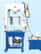
Butterfly Valve Testing Machine