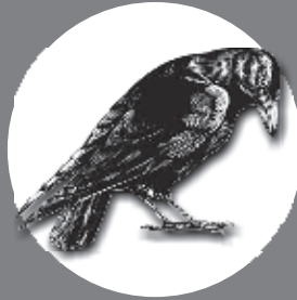
Crow 15 Years

General Knowledge Making Tomorrow Brighter