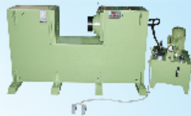
Horizontal Model Press

Special Purpose Machineries High Speed Hydraulic Deep Drawing Press Rubber/Bakelite Moulding Hot Presses Hydraulic Presses, Power Packs, Cylinders Computer Sambrani, Dhoop stick M/c.. Valve Pressure & Life Cycle Testing M/c. Pneumatic, Hydro-Pneumatic Presses Arecanut Leaf Plate, Semia-Idiyappam, Chapati Press.