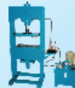
Hydraulic Press with Bottom Ejector