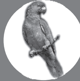
Parrot 140 Years