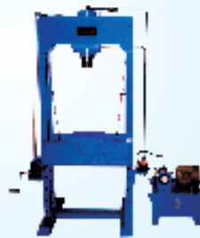
2 Pillar Model Press