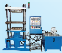
Rubber Moulding Machine