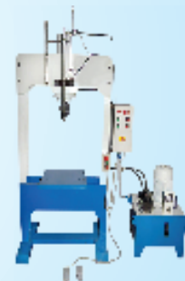
Special Application Machine