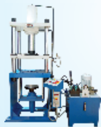
4 Pillar Model Press