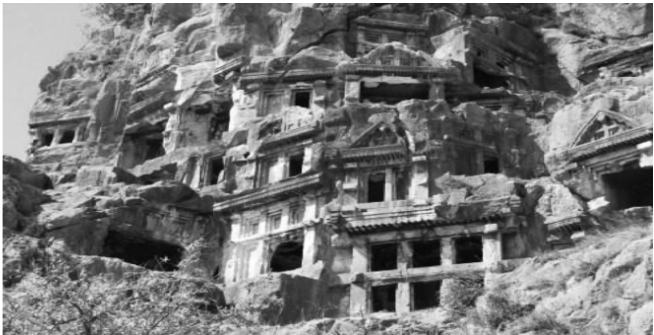
Lycian Rock Tombs at Myra