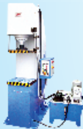
C - Frame Model Press